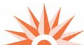
Table de concertation des aînés de l'île de Montréal

Ce bulletin a été réalisé grâce à la participation financière de la Ville de Montréal