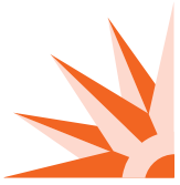
Table de concertation des aînés de l'île de Montréal